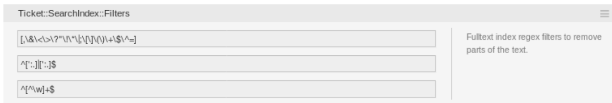
2. ábra: Ticket::SearchIndex::Filters beállítás

Ticket::SearchIndex::Filters Szabad-szavas index reguláris kifejezés szűrők a szöveg részeinek eltávolításához.