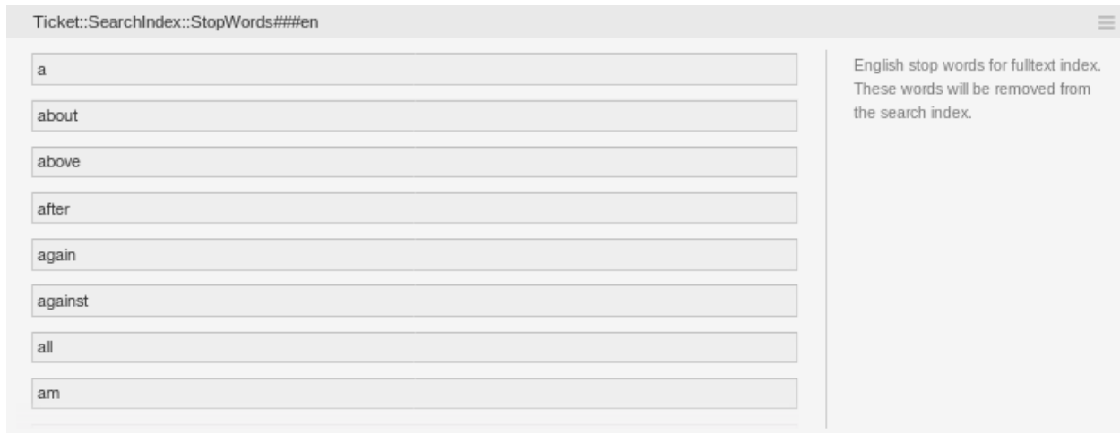
Abb. 3: Ticket::SearchIndex::StopWords###en Einstellung