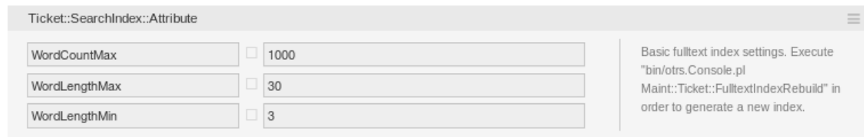
Abb. 1: Ticket::SearchIndex::Attribute Einstellung

Ticket::SearchIndex::Attribute Grundlegende Einstellungen für den Volltextindex.